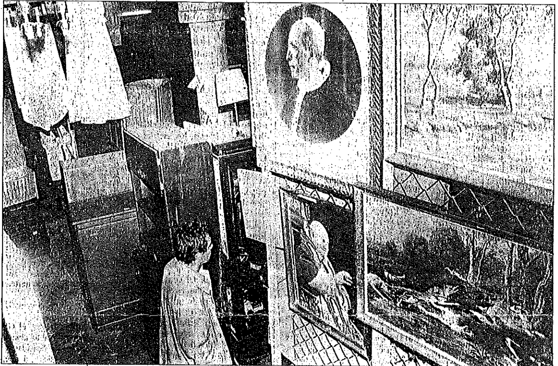
La recuperación y el reciclaje es uno de los campos de la economía alternativo.

Asimismo, los participantes acordaron mantener una estrecha relación con la Red de Economía Alternativa y Solidaria (REAS), sección en el Estado español de la red europea RBEAS, como órgano coordinador de los dife-