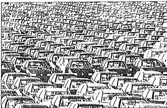
BAJO INTERÉS Hay quien presta a bajo interés. Su cadena de producción es otra.

En Gran Bretaña y Estados Unidos también funcionan algu-