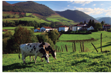
Imágenes de Gure Sustraiak, albergue Baitu y Casa Rural Jauregia, ejemplos de turismo sostenible en Navarra.