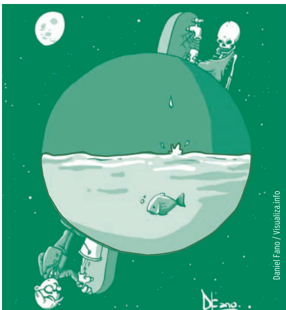
Daniel Fano / Visualiza.info

Mientras, aquí en el Norte, las transnacionales amenazan con deslocalizar sus empresas, instalándose en países donde no tienen que cumplir exigencias medioambientales y fiscales, ni derechos laborales.