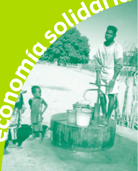
Alvaro Cía / Visualiza.info