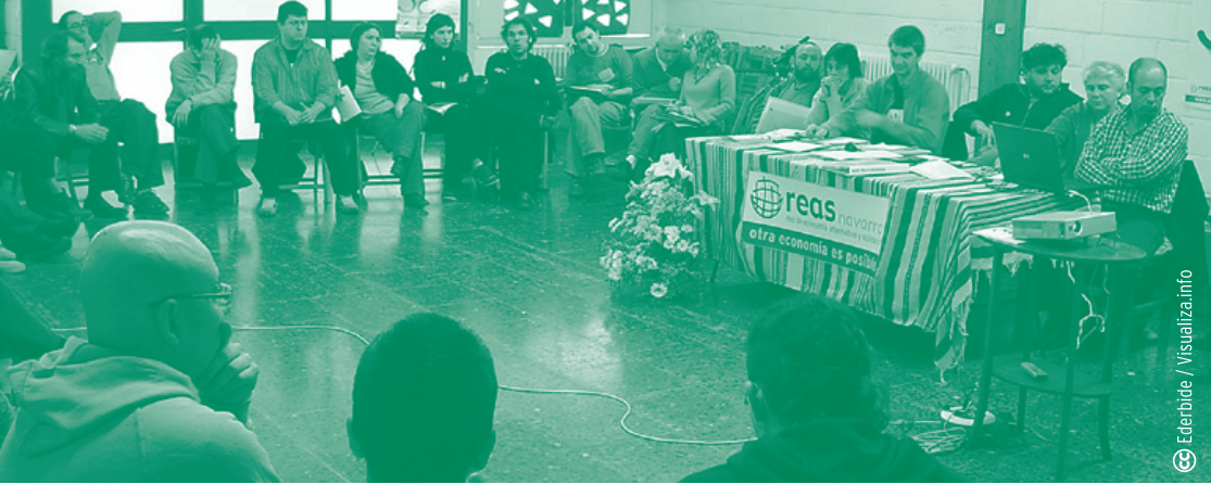
Ederbide / Visualiza.info