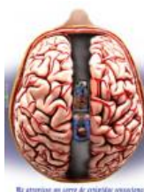
No atiencas a una de estas ideas

Cuando nos referimos al comercio justo consideramos una serie de criterios de producción en origen: de respeto al medioambiente, de pago de un salario digno, de igualdad de género..., a la vez que reivindicamos su aplicación a todos los actores que integran la cadena comercial.