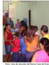
Foto: Caja de atención del Banco Caju da Praia